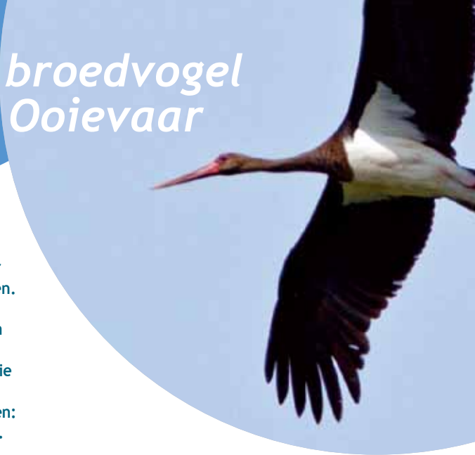
Zwarte Ooievaar, 28 mei 2008, Grevenbicht.